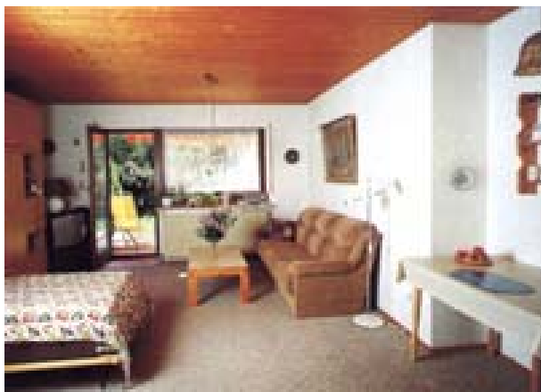
↑ Appartement Nr. 1 bzw. 2

Unser familiär geführtes Haus steht da, wo Bad Brückenau am schönsten ist. Die Gäste genießen besonders den Blick von ihren Südhangterrassen in das idyllische Sinntal. Unsere Apartments und die Ferienwohnung befinden sich in der Nähe des Gesundheits-Resorts Regena und der BfA-Hartwaldklinik.