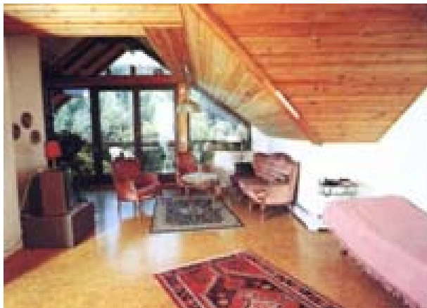
↑ Ferienwohnung Nr. 6 (Studio)